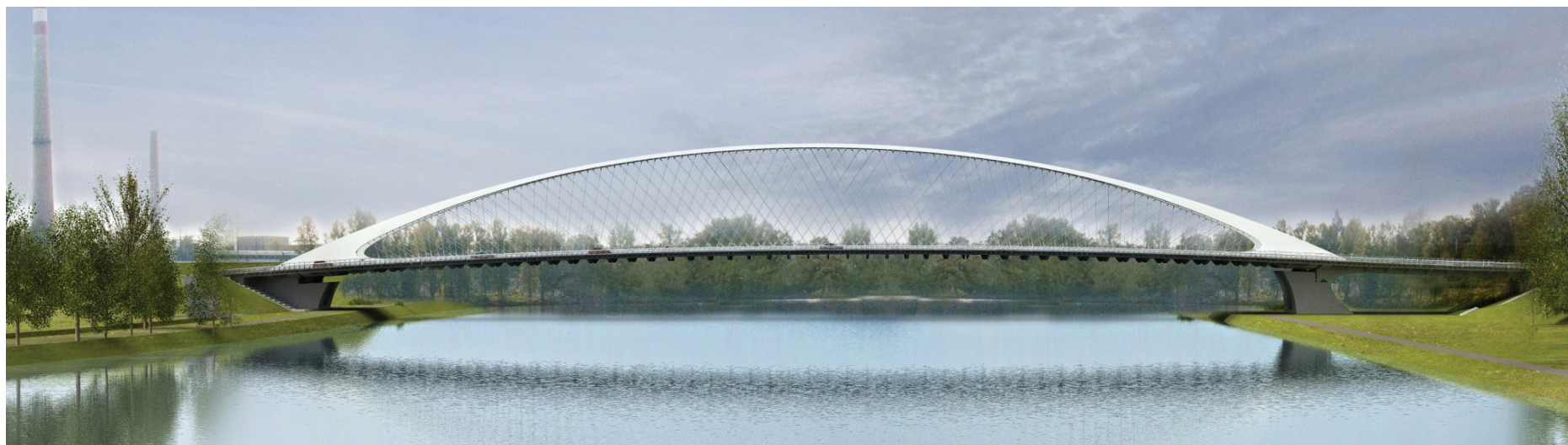
pohled proti proudu